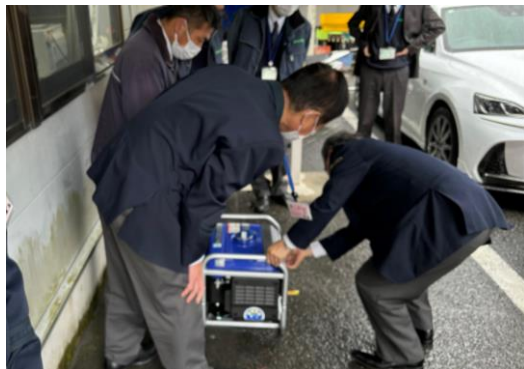
発電機を使用している訓練の様子